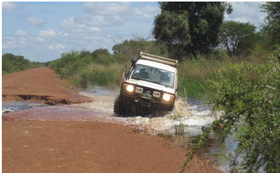
Sud Sudan, uno dei contesti più difficili per quanto riguarda i trasporti

di riferimento: dove disponibile, il programma ha offerto supporto al sistema di riferimento con ambulanza di ciascun sito, fosse questo su gomma o su barca. Complessivamente, durante il 2019 sono stati realizzati 6.183 trasporti con ambulanza .