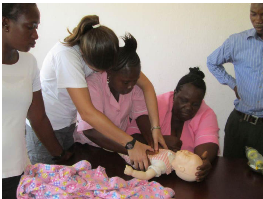
Formazione del personale locale in Sierra Leone

La formazione del personale sanitario e degli agenti comunitari è una leva importantissima per la buona riuscita del programma. Le formazioni d'aula e on the job del personale già presente negli ospedali e nelle strutture sanitarie periferiche aiuta a migliorare la qualità complessiva delle cure. Sono state 258 le risorse umane sanitarie formate o aggiornate attraverso sessioni teoriche e/o pratiche on the job all'interno delle strutture coinvolte nell'intervento e 2.256 gli agenti comunitari formati.