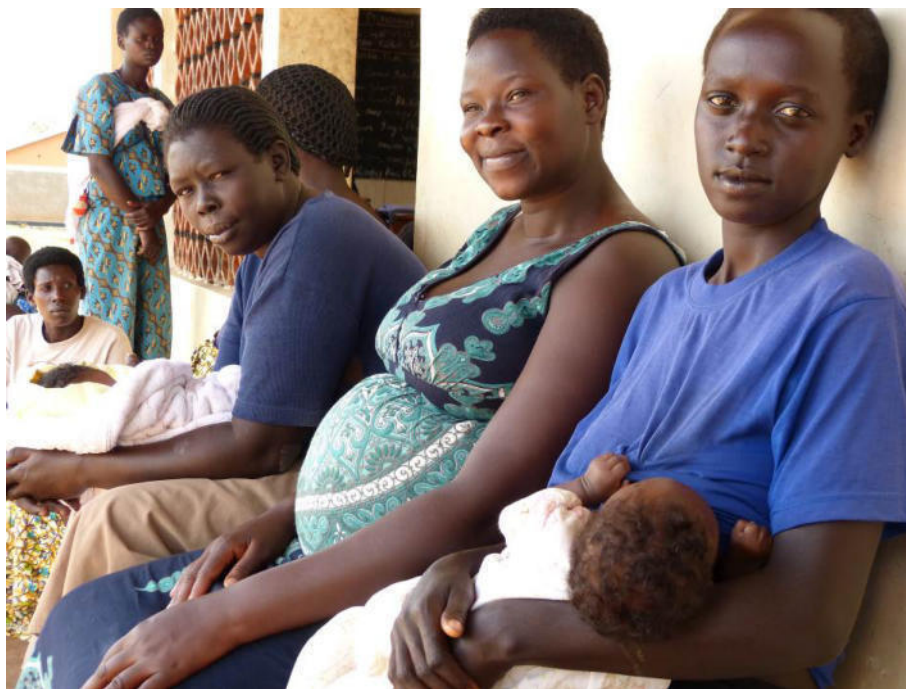
Uganda, distretto di Oyam, donne in attesa delle visite pre e post natali

Ci si è dati quindi un nuovo obiettivo, quello di arrivare a 1.200.000 visite prenatali e post natali effettuate entro lo scadere dei 5 anni del progetto. Pertanto il grado di raggiungimento del nuovo target è attualmente del 69%