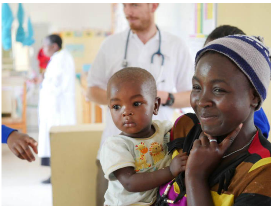
Ospedale di Tosamaganga, Tanzania, una mamma e il suo bambino

L'intervento, rispetto alla prima fase si è allargato e raggiunge ora 7 paesi dell'Africa (Angola, Etiopia, Mozambico, Sierra Leone, Sud Sudan, Tanzania e Uganda) e si svolge in 10 ospedali (Chiulo, Wolisso, Montepuez, Pujehun, Yiol, Lui, Tosamaganga, Songambe, Aber, Matany) e nei loro rispettivi territori di riferimento. Lo scopo è quello di ottenere un risultato duraturo e concreto nella riduzione della mortalità materna e infantile.